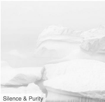
Silence & Purity